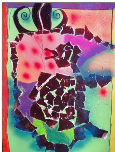
petra cyprichová, 5. roč.