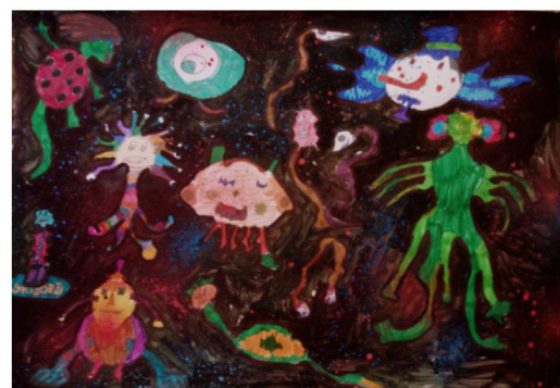
paulína maťašeje, 2.roč.