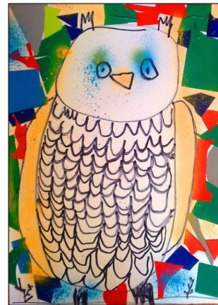
šimon just, prípr. štúdium